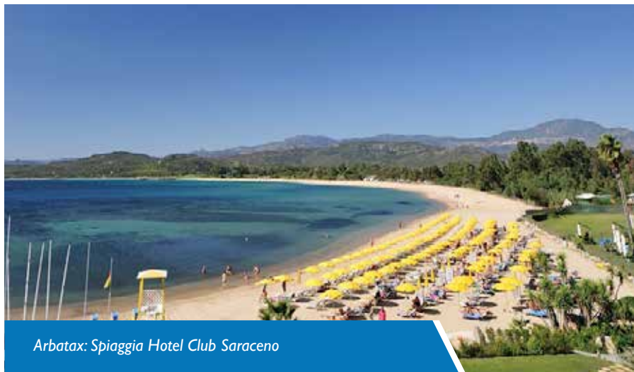
Arbatax: Spiaggia Hotel Club Saraceno