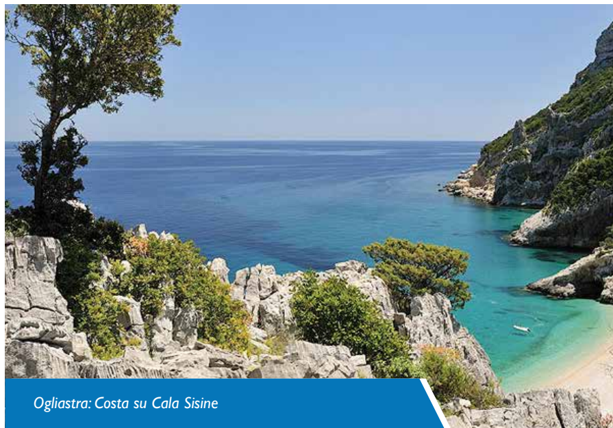
Ogliastra: Costa su Cala Sisine