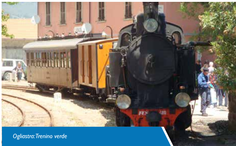
Ogliastra: Trenino verde

e-mail: segreteria@mcrelazionipubbliche.it