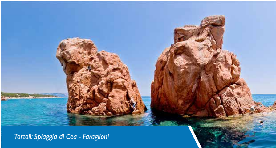
Tortoli: Spiaggia di Cea - Faraglioni

Psicologa - Psicoterapeuta presso il Dipartimento di Salute Mentale Centro Aziendale di Terapia del Dolore – ASL Lanusei