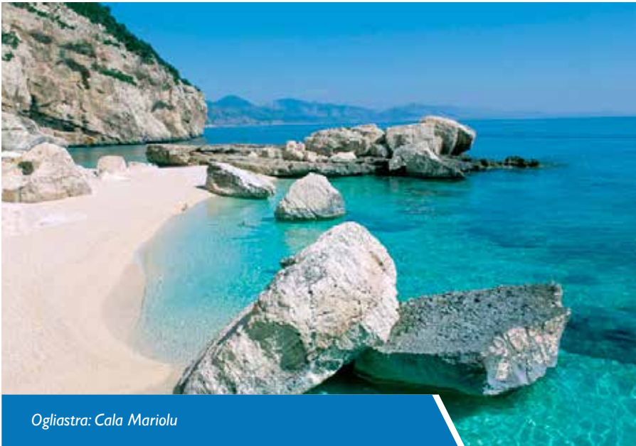
Ogliastra: Cala Mariolu

Causale versamento: Iscrizione Nome e Cognome al 7° Incontro Sardo-Europeo TD e CP 2014 + cena sociale.