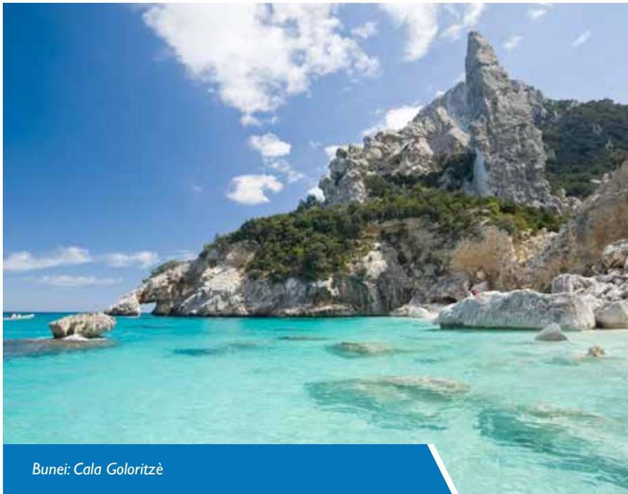
Bunei: Cala Goloritzè