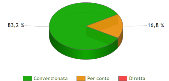
Ripartizione spesa lorda per canale di dispensazione